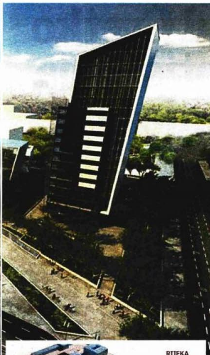
RIJEKA PROJEKT OBNOVE KOMPLEKSA RIKARD BENČIĆU VIZIJI IDISA TURATA

Svoje su prijave poslali i Split, Dubrovnik, Pula, Zadar, Osijek, Đakovo i Varaždin