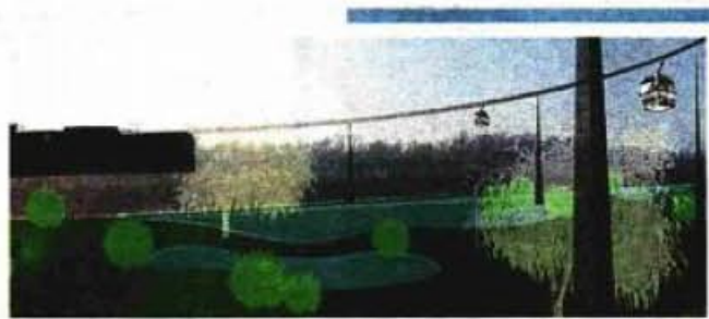
ZAGREB NIZ JE JAKIH VIZUALA U SKLOPU VIŠEGODIŠNJEG PROJEKTA ZAGREB NA SAVI